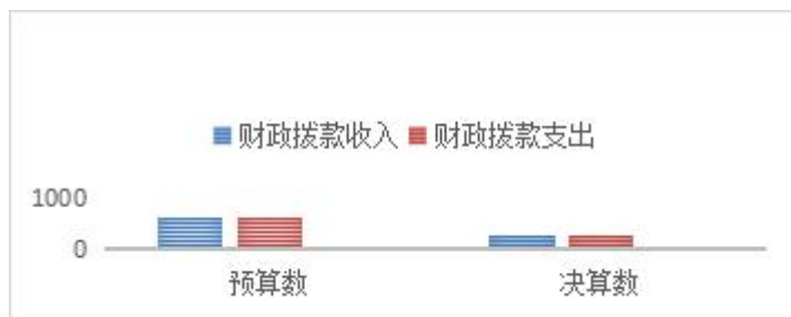
财政拨款收支与年初预算数对比图

3. 国有资本经营预算财政拨款本年收入 0 万元，与年初预算数持平，主要是无国有资本经营预算财政拨款收入；支出 0 万元，与年初预算数持平，主要是无国有资本经营预算财政拨款支出。