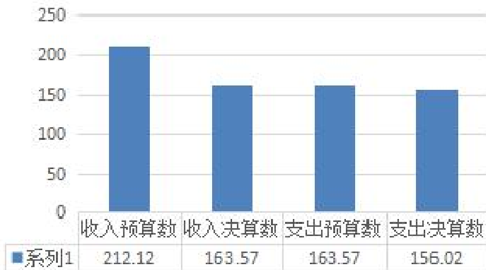
财政拨款收支预决算对比情况

完成年初预算的 77.11%，比年初预算减少 48.55 万元，决算数小于预算数主要原因是严格执行财务制度，强化预算管理制度，严控办公费、三公经费、汽车租赁费用支出；本年支出 156.02 万元，完成年初预算的 95.38%，比年初预算减少 7.55 万元，决算数小于预算数主要原因是严控办公费、三公经费、汽车租赁费用支出。