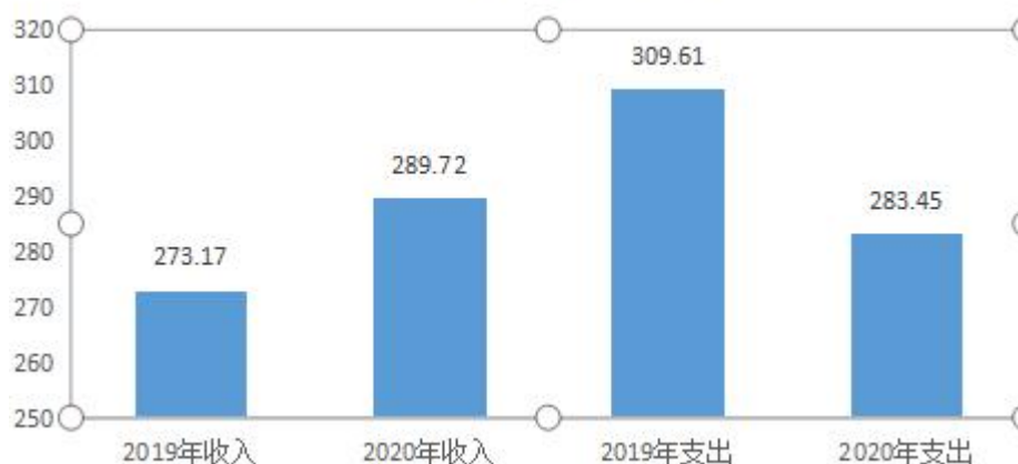
图3：财政拨款收支与上年决算数对比

本部门 2020 年度财政拨款收支均为一般公共预算财政拨款，其中本年收入 289.72 万元，比 2019 年度增加 16.55 万元，增长 6.06%，主要是人员增加；本年支出 283.45 万元，减少 26.16 万元，降低 8.45%，主要是严格控制经费支出。