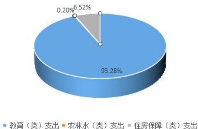
图4：财政拨款支出决算结构（按功能分类）

2020 年度财政拨款支出 283.45 万元，主要用于以下方面：教育（类）支出 264.39 万元，占 93.28%；农林水（类）支出 0.58 万元，占 0.20%；住房保障（类）支出 18.49 万元，占 6.52%。