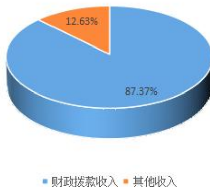
图 2：收入决算构成情况