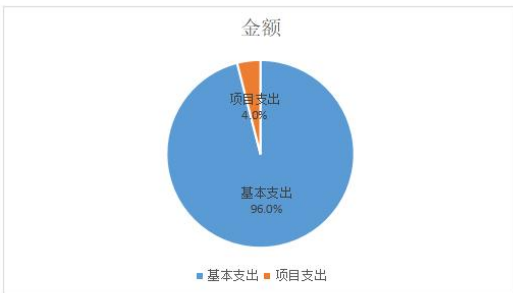
图3：支出决算构成情况（按支出性质）

本单位2022年度支出合计3052.7万元，其中：基本支出2931.36万元，占96.0%；项目支出121.34万元，占4.0%；经营支出0万元，占0.0%；对附属单位补助支出0万元，占0.0%。