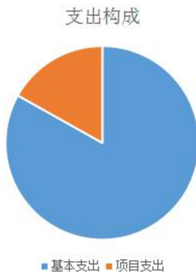
图 2：支出构成情况（按支出性质）