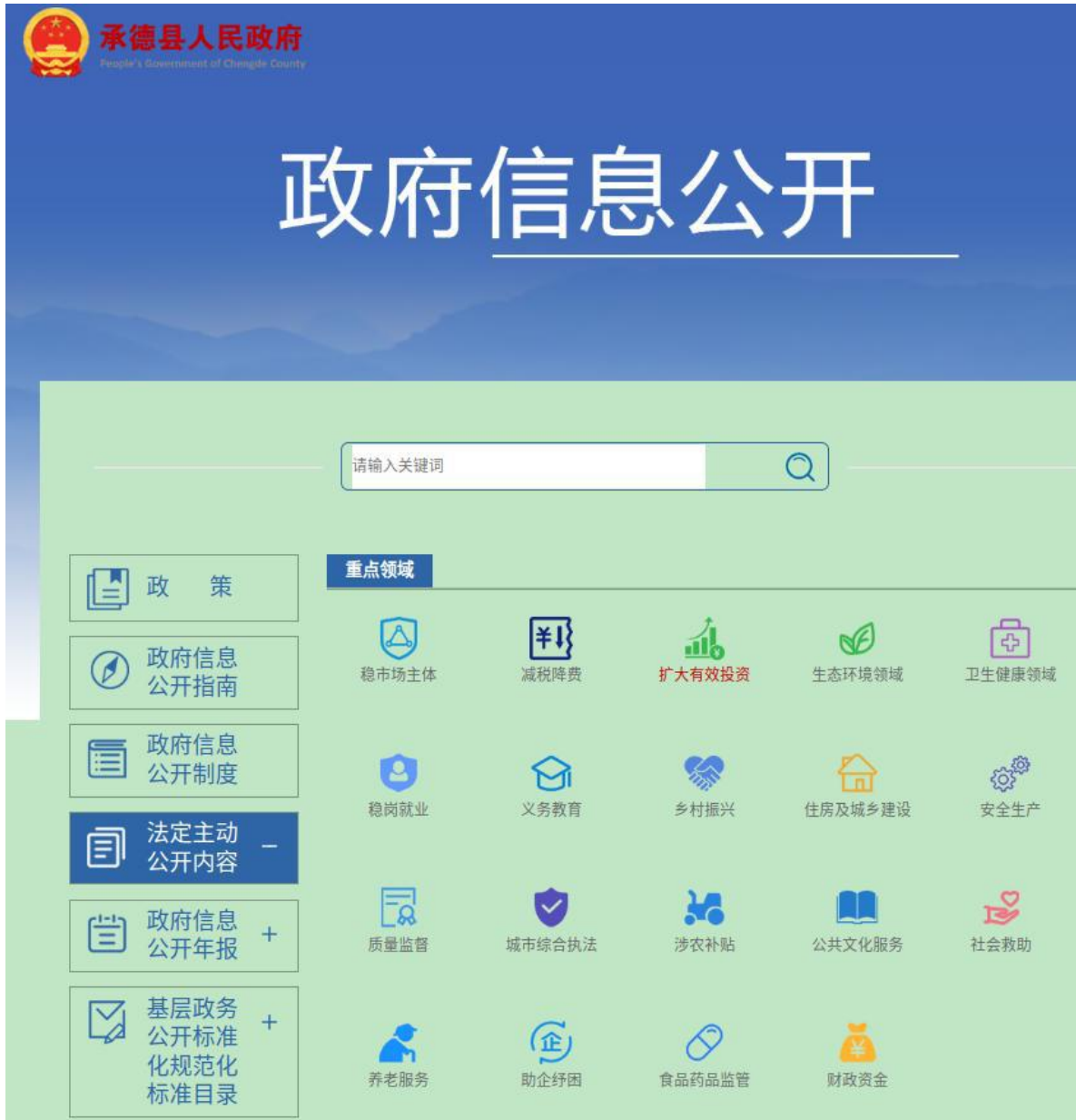
图 1-政府信息公开平台

(一) 加强组织领导。 县政府高度重视政府信息公开工作，把政府信息公开工作纳入年度工作计划，摆上重要议事日程，切实加强组织领导。把政府信息公开工作职责落实到分管领导和具体工作人员，形成“主要领导亲自抓，分管领导具体抓，职能股室抓落实”的工作格局，有力的保障了政府信息公开工作的顺利