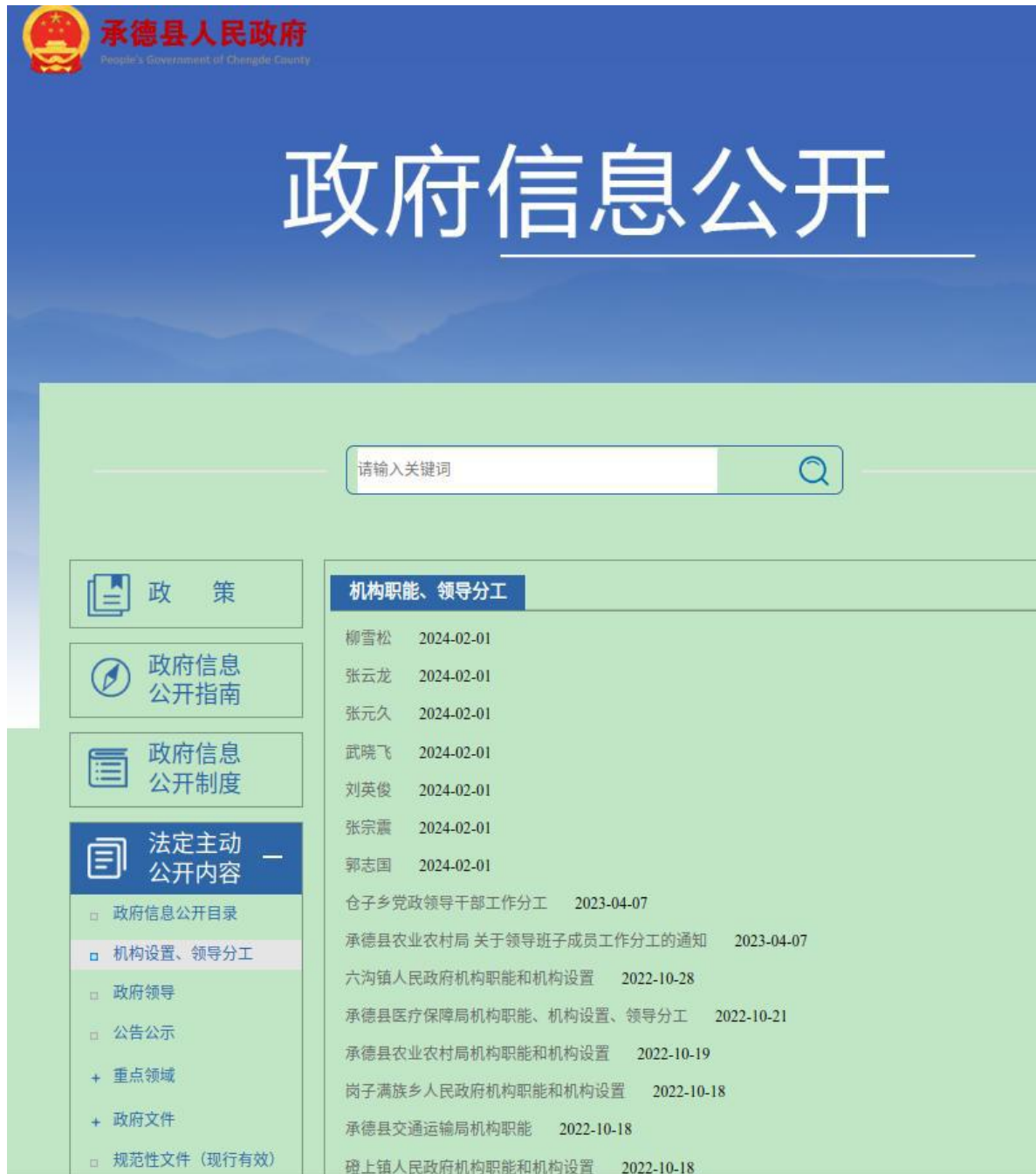
图 2-领导分工、机构职能

（二）健全工作制度。 优化相关工作制度，进一步明确了政务信息公开范围、公开方式和网民留言办理流程，做到政务信息