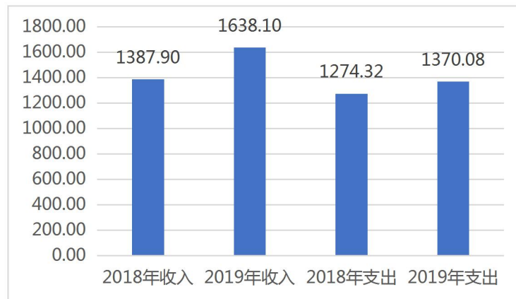
图 3：2018-2019 年财政拨款收支情况

本部门 2019 年度形成的财政拨款收支为一般公共预算财政拨款 1638.10 万元，其中本年收入 1638.10 万元，比 2018 年度增加 250.2 万元，增长 18.03%，主要是项目支出增加；本年支出 1370.08 万元，增加 95.76 万元，增长 7.52%，主要是项目支出增加。