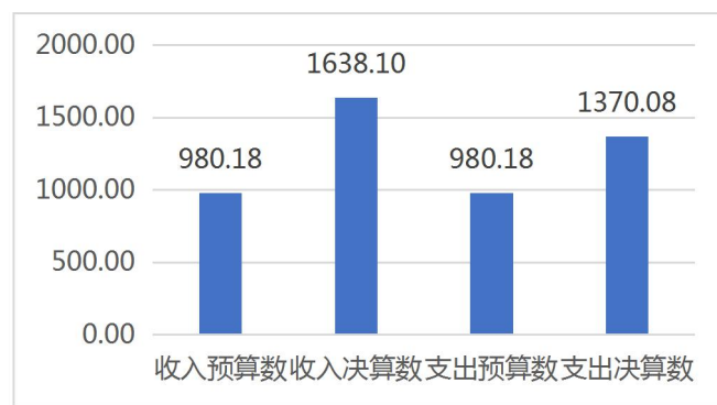
图4：财政拨款收支预决算对比情况

本部门2019年度一般公共预算财政拨款收入1638.10万元，完成年初预算的167.12%（如图4），比年初预算增加657.92万元，决算数大于预算数主要原因是项目支出增加；本年支出1370.08万元，完成年初预算的139.78%，比年初预算增加38.99万元，决算数大于预算数主要原因是主要是项目支出增加。