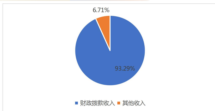
图 1: 收入构成情况

本部门 2019 年度本年收入合计 1755.98 万元，其中：财政拨款收入 1638.10 万元，占 93.29%；其他收入 117.88 万元，占 6.71%。如图所示：